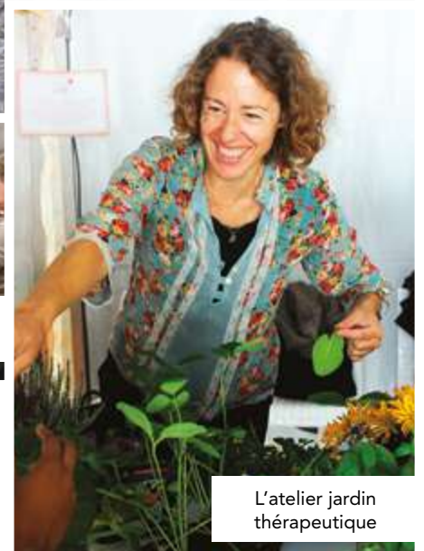
L'atelier jardin thérapeutique