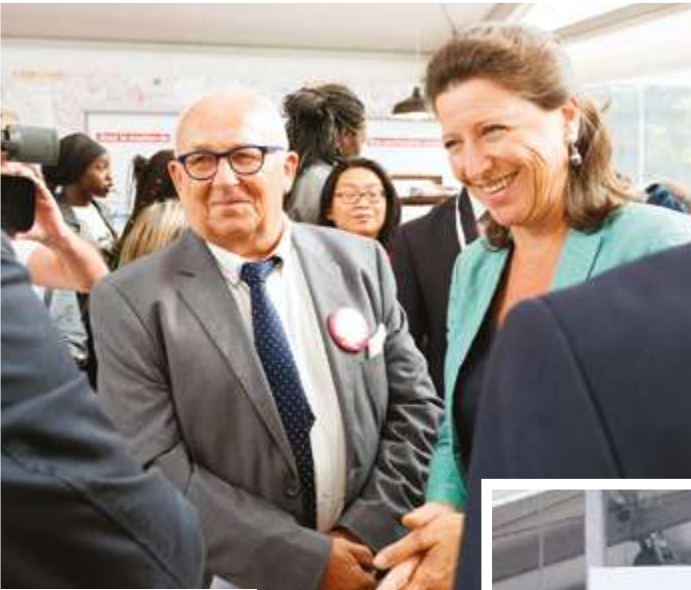
Agnès Buzyn, ministre des Solidarités et de la Santé

La 5 e édition du Village Alzheimer® s'est tenue du 21 au 24 septembre à Paris. Objectifs : sensibiliser et informer le grand public sur la maladie et son accompagnement.