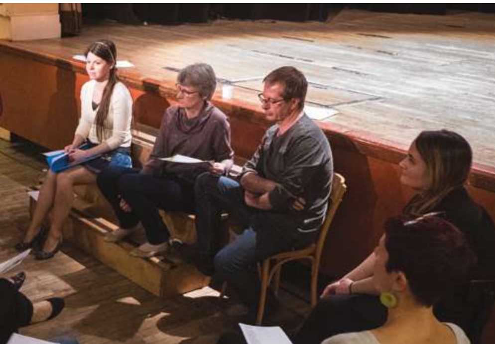
Atelier théâtre à Metz - France Alzheimer Moselle