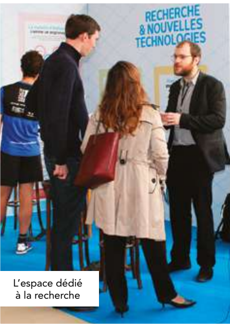
L'espace dédié à la recherche