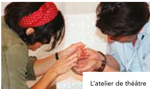
L'atelier de théâtre