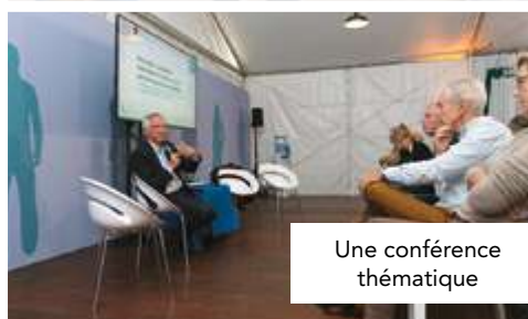
Une conférence thématique