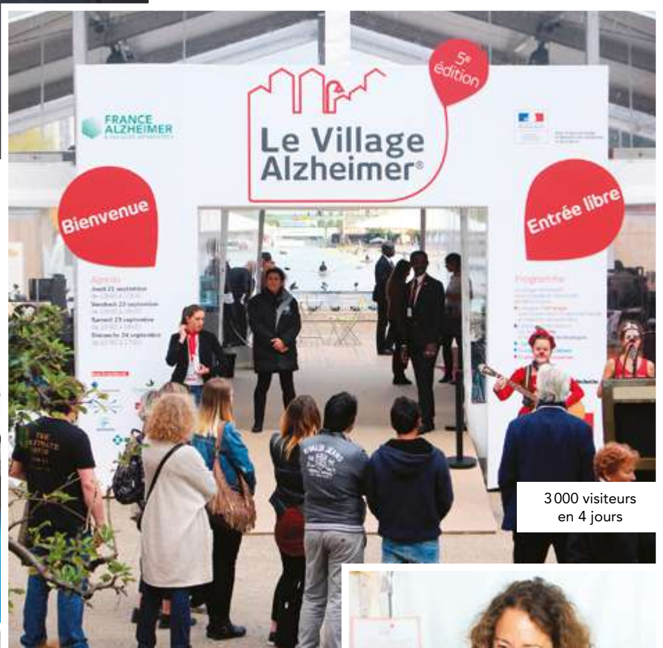
3 000 visiteurs en 4 jours