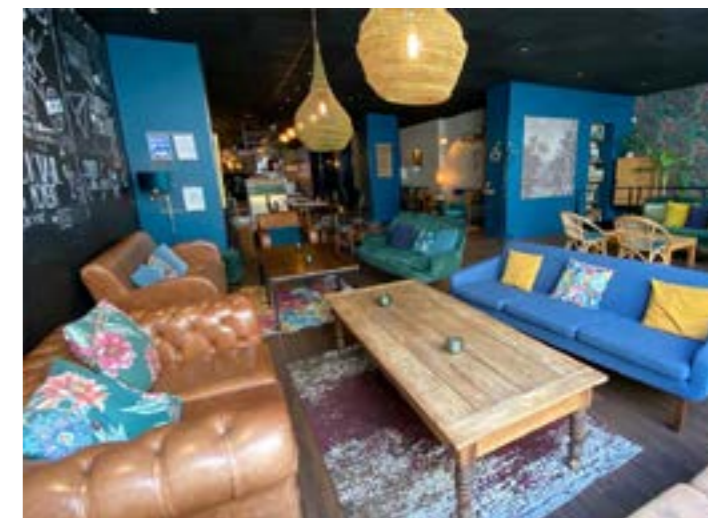
La Cour, à Angers, un endroit cosy pour discuter tranquillement