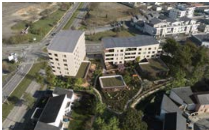
Vue aérienne du projet ODISSEA à Angers