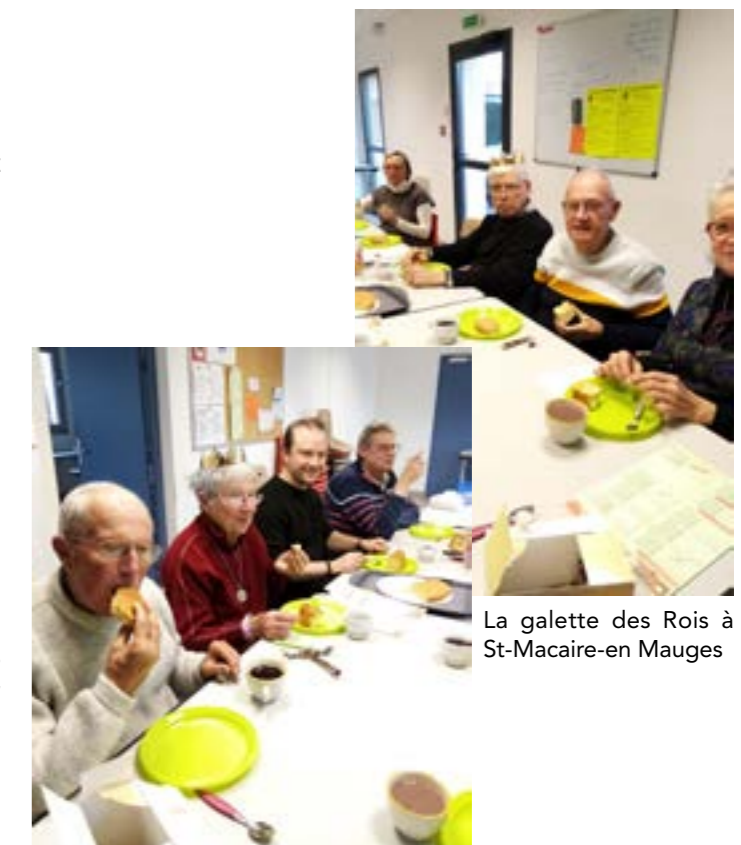
La galette des Rois à St-Macaire-en Mauges