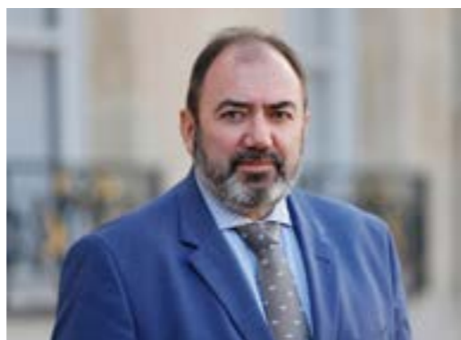
François BRAUN, ministre de la Santé (du 04/07/2022 au 20/07/2023)

Suite au remaniement ministériel de juillet 2023, espérons qu'Aurélien ROUSSEAU, ministre de la Santé, Aurore BERGÉ, ministre des Solidarités et des Familles ainsi que Sylvain RETAILLEAU, déjà ministre de l'Enseignement supérieur et de la Recherche travailleront dans une perspective commune pour répondre aux enjeux de demain.