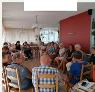
Réunion des bénévoles