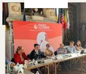
Réunion régionale Angoulême