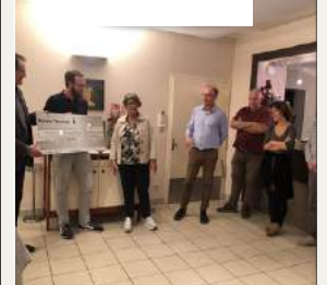
Remise chèque Course des Garçons de café