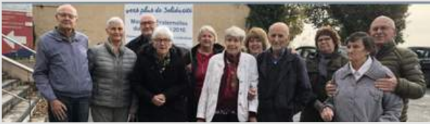
Repas du 24/11/2022 avec les participants